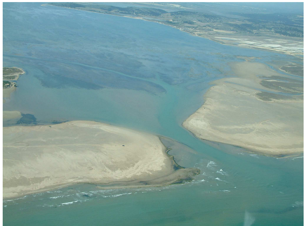
Le grau de l'étang de l'Ayrolle – Photo : Henri Farrugio – Ifremer.